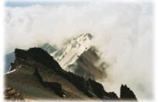
Erciyes, zirveden güneye bakış.

Madem ki cennetten sürgünüz, ruhlarımız hep o nihai yazgının, o yitik yazgının peşinde olacaktır. O yüz-