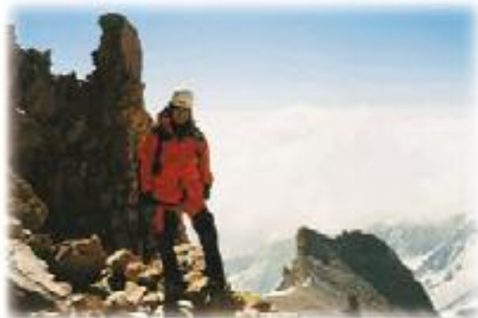
Erciyes Zirvesi (3917 m)

Zirve de tıpkı yolun sonundaki ışık gibi hep daha yücelere çıktığı zaman anlam kazanacaktır. Aslında biz zirveye çıkarken zirve de kendinden daha yücelere tırmanır bizim içimizde. Erciyes zirvesine çıktığımda inanılmaz bitkinlik içinde kalmıştım. Bir an, artık 4.000 m'lik dağlar yeter bana diye geçirmiştim içimden. İçimden başka bir ses şiddetle muhalefet etmişti bu düşünceye. Yeter dediğimde Ağrı Dağı hedefim dışına çıkmış oluyordu. Böyle bir karar yaptığım işe nokta koymak, kendimi inkar etmektir bir bakıma. Yetindiğimiz an yaşama heyecanım ve üretim coşkusunu da yitirmiş oluruz.