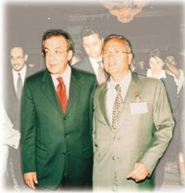
Devlet Bakanı Sn. Recep Önal Yönetim Kurulu II. Başkanımız Sn. Yalçın Öner'le birlikte

Uyguladığımız ekonomik program sonucu, enflasyonun düşmesi ve döviz kuru artışının makul ve istikrarlı seyretmesi durumunda, belirsizlik nedeniyle girilemeyen orta ve uzun vadeli kâr-zarar ortaklığı projelerine (emek-sermaye ortaklığına dayanan “venture capital” benzeri